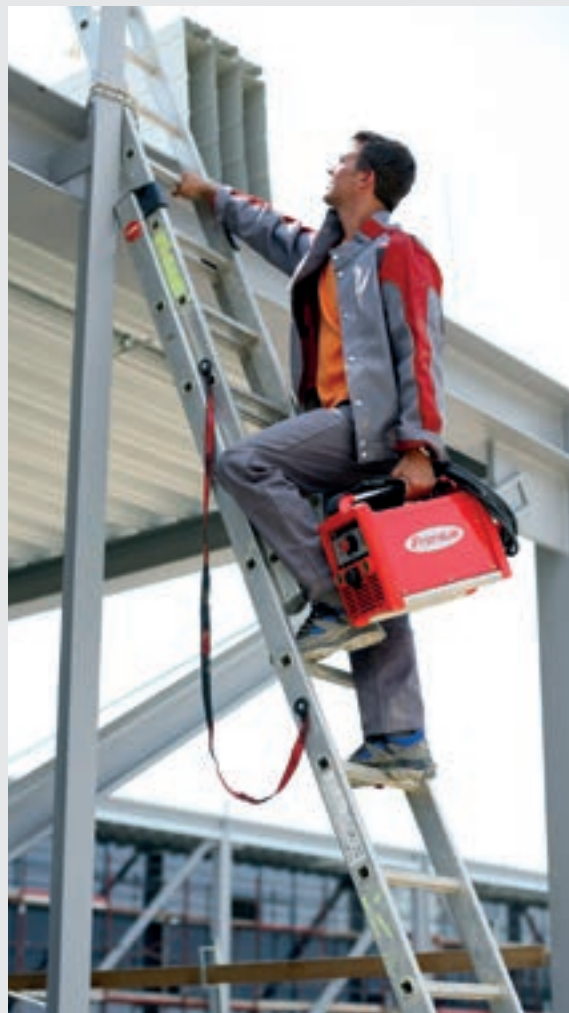
/ Léger et mobile, donc à sa place sur tous les chantiers de construction.