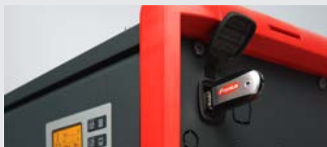
/ Porta USB